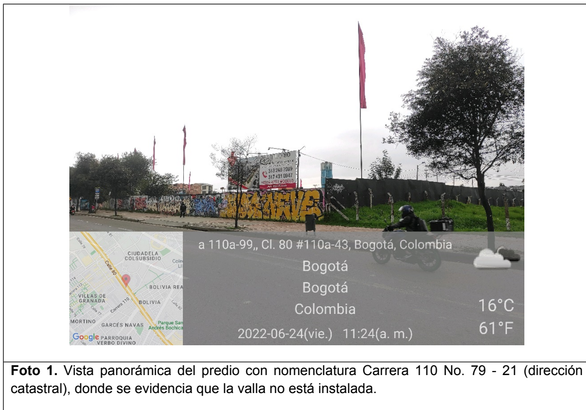
Foto 1. Vista panorámica del predio con nomenclatura Carrera 110 No. 79 - 21 (dirección catastral), donde se evidencia que la valla no está instalada.